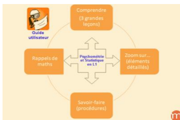
Psychométrie et statistiques