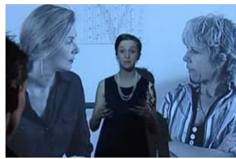
Effets de la catégorisation