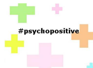
Introduction à la psychologie positive